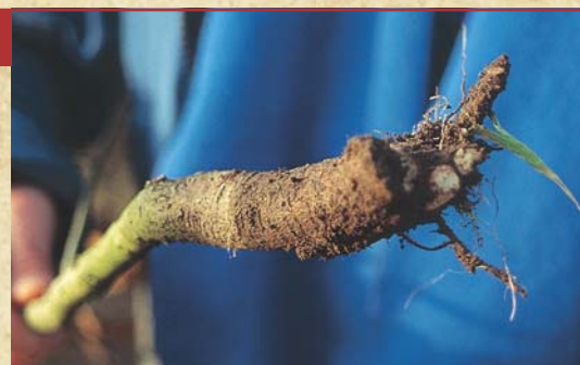
Dégâts de mulots sur un jeune plant.