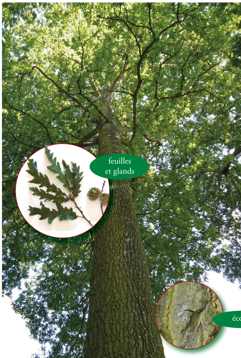
feuilles et glands