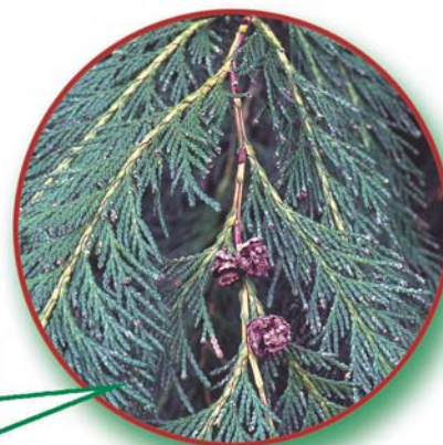
Rameau avec cônes à maturité