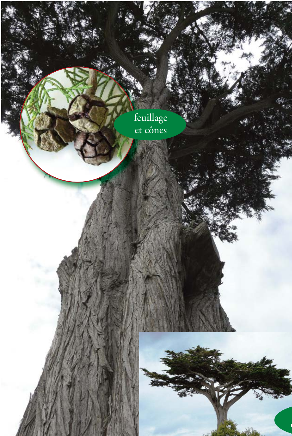
feuillage et cônes