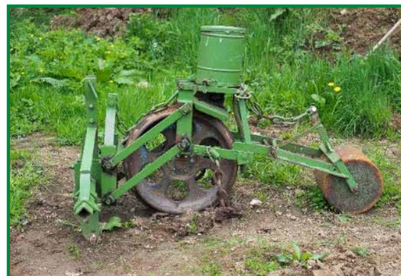
Semoir à graines de pins