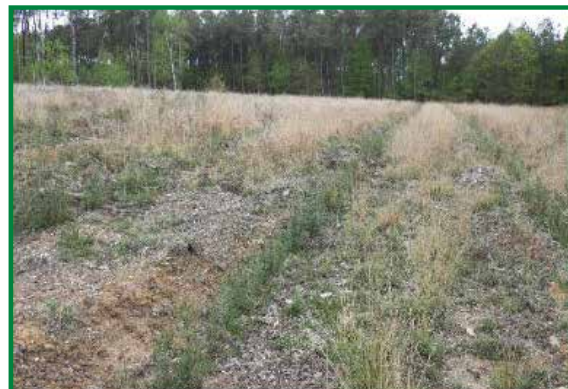
Semis en ligne