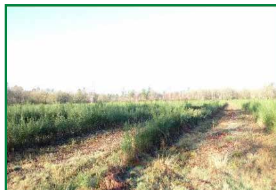
Semis de 2 ans dégagé entre les lignes