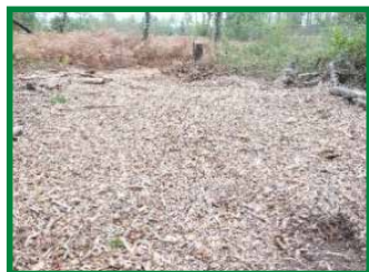
Broyage en plein