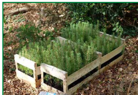
Plants de pins maritimes en godet