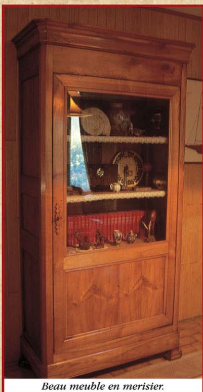
Beau meuble en merisier.

Il est très recherché principalement en mobilier (placage industriel ou meuble massif). Au demeurant, c'est un bon bois de feu !