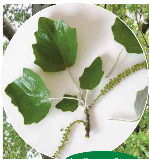
feuillage et fleurs