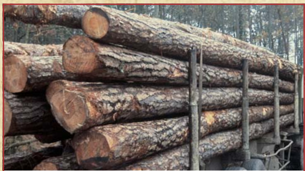
Belles grumes de pin Laricio.