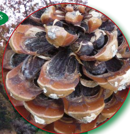
cône et graines