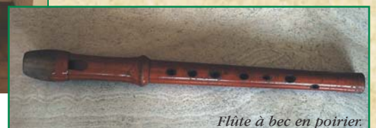
Flûte à bec en poirier.

POUR EN SAVOIR PLUS : - A la découverte des fruitiers forestiers en Bretagne CRPF Bretagne (2000)