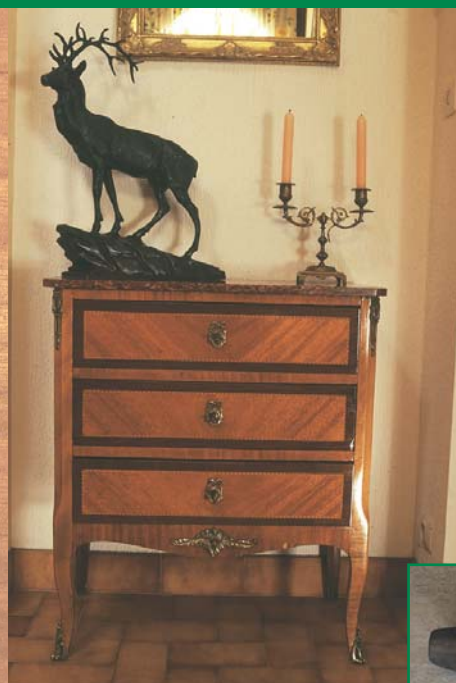
Commode ancienne en poirier et bois exotique