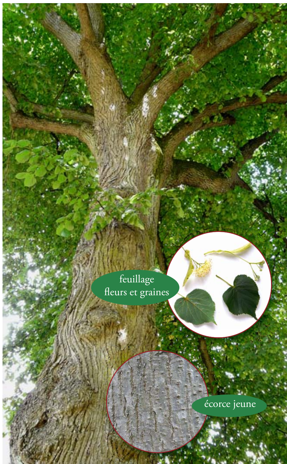
feuillage fleurs et graines