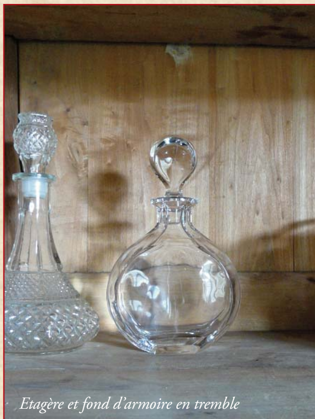
Etagère et fond d'armoire en tremble

POUR EN SAVOIR PLUS : Guide de dendrologie – ENGREF (1992)