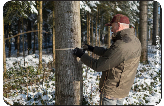
Mesure de la circonférence à 1.30 m au ruban forestier par le propriétaire