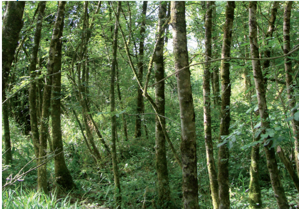
O. Carbot - PNR Marais Poitevin

Cet habitat d'un grand intérêt patrimonial est typique des forêts inondables riveraines des grands fleuves comme la Loire.