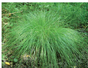
B. Rolland - CRPF RA

Elle est souvent dominée par les laïches : Ronce bleue, Cardamine des prés, Primevère élevée.