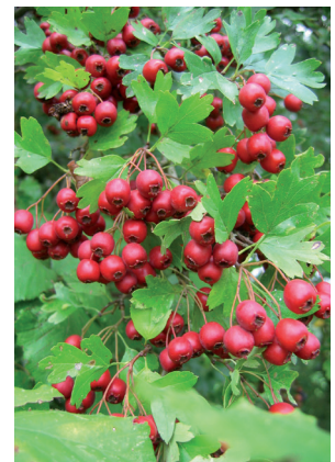
B. Longa - CRPF PDL