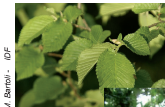
M. Bartoli - IDF

Les Frênes commun et oxyphylle, l'Orme et le Chêne pédonculé sont les principaux arbres représentatifs de l'habitat.