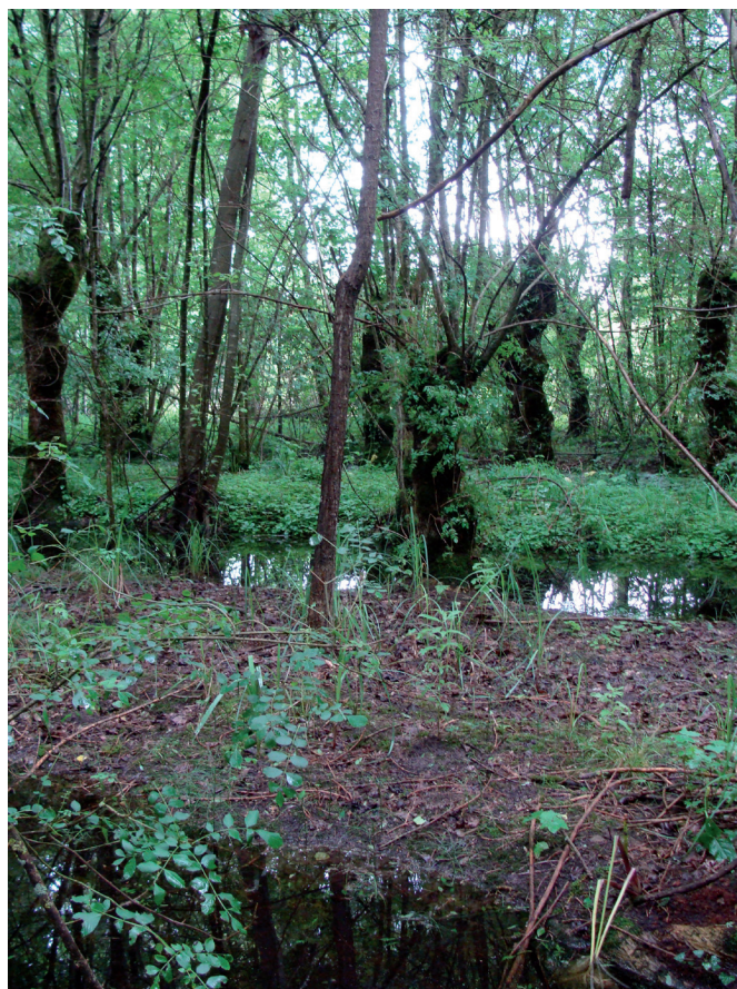
O. Cardot - PNR Marais Poitevin

Cet habitat est typique des forêts inondables.