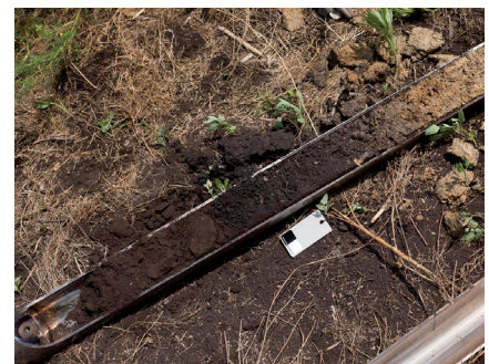
S. Gaudin - CRPF CA

Ce sont des sols alluviaux peu évolués, limoneux, limono-argileux ou sableux. Leur fertilité est généralement élevée.