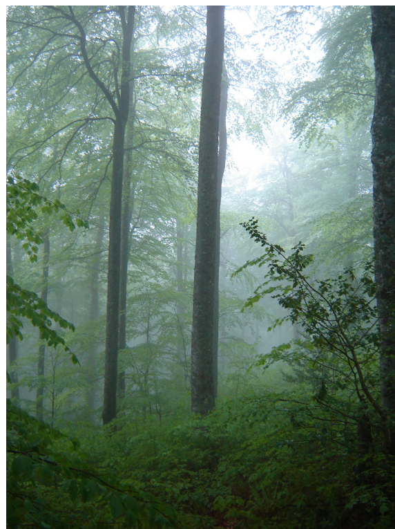
Eviter La monoculture du hêtre.