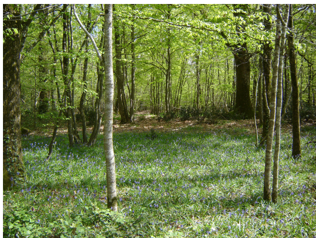
En Pays de la Loire, les hêtres sont minoritaires.

En Pays de la Loire, ce sont les chênes sessiles et/ou pédonculés qui dominent. Ils sont généralement accompagnés par le charme en taillis.