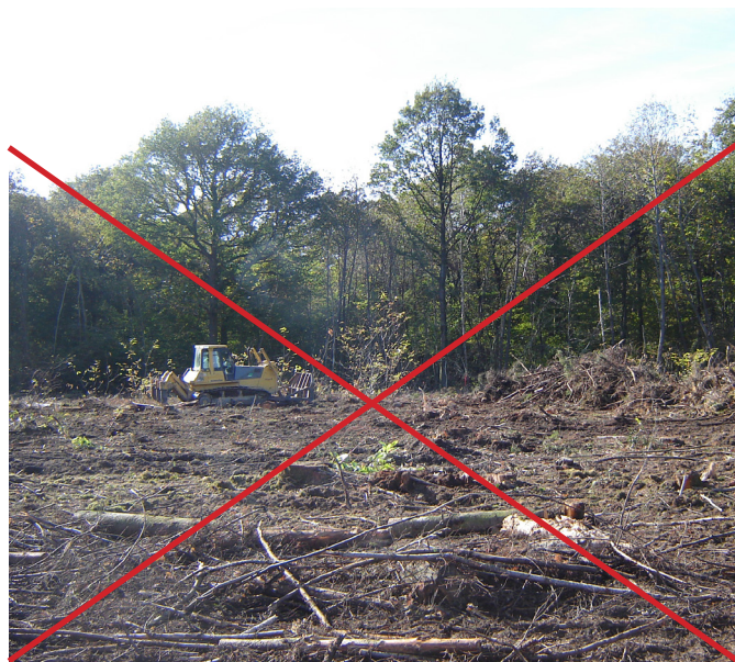
Proscrire tout dessouchage et gros travaux du sol.