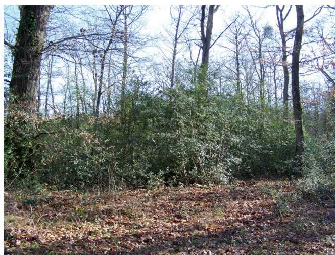
Sous-bois de houx.