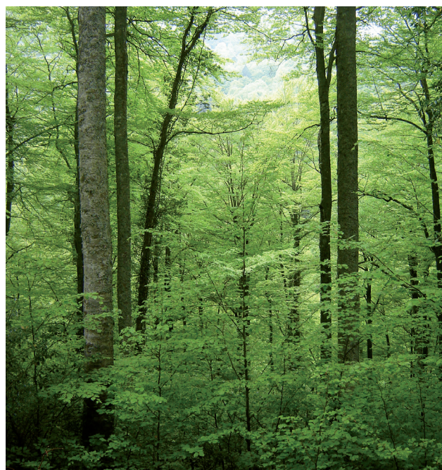
Eviter la monoculture du hêtre.

Lien permettant l'accès aux cahiers d'habitats Natura 2000 : http://inpn.mnhn.fr/docs/cahab/tome1.pdf Code Natura 2000 : n° 9120-2 code Corine 41.12 - Hêtraies-chênaies collinéennes à Houx.