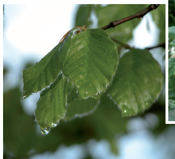
D. Belay - CRPF PDL

Le Hêtre devrait être l'essence dominante sur ce type d'habitat mais la gestion sylvicole de ces peuplements sur notre région l'a relégué au second plan donnant une place prépondérante aux chênes (sessile et pédonculé).