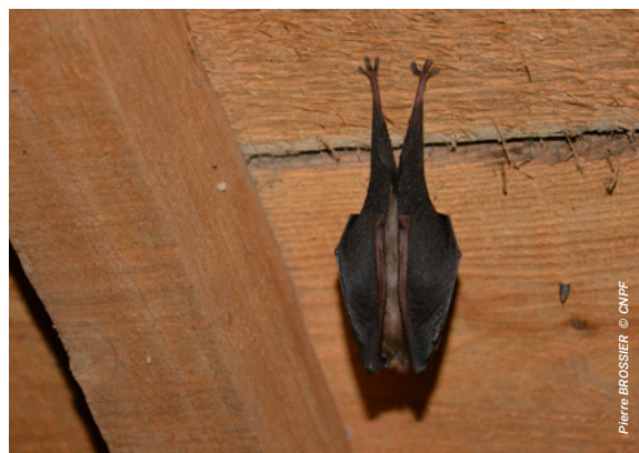
Petit rhinolophe dans un comble