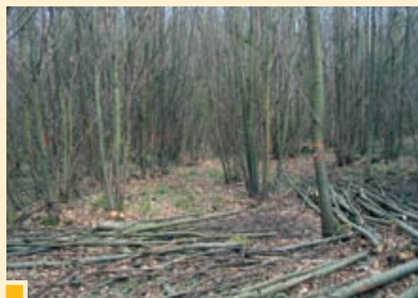
Taillis de châtaignier de 12 ans en cours de balivage au profit de tiges d'avenir préalablement désignées