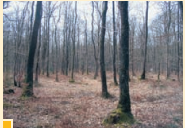
Taillis de chêne rouvre balivé en plein il y a 12 ans

Cette méthode vise, par des coupes adaptées, à faire évoluer un taillis vers un peuplement majoritairement producteur de bois d'œuvre constitué de souches ne comportant à terme qu'un seul brin de forte dimension, alors appelé « futaie sur souche ». La conversion en futaie sur souche s'applique aux peuplements dans lesquels le taillis domine nettement ou est exclusif. Les techniques utilisables sont décrites ci-après.