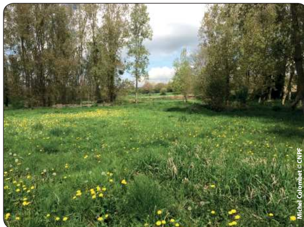
Prairie pâturée sur station P1

Cortège de plantes enrichi d'espèces arbustives (sureau, prunellier, fusain, frêne, aubépine...) ou herbacées tolérant ou recherchant l'ombre (euphorbe des bois, mercuriale pérenne, lierre terrestre, ficaire fausse renoncule, scolopendre, primevère acaule, ail des ours, benoîte commune ...).