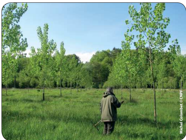
Peupliers Taro âgés de 3 ans (placette CETEF 56019)