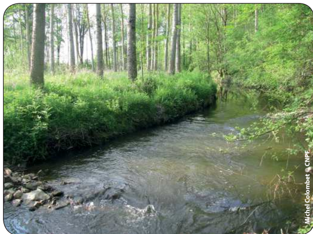
Peupleraie de bord de rivière