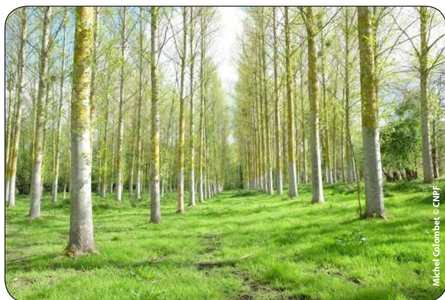
Peupliers interaméricains (Boelare)