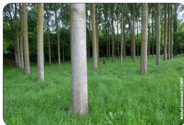
Peupliers euraméricains (Robusta)