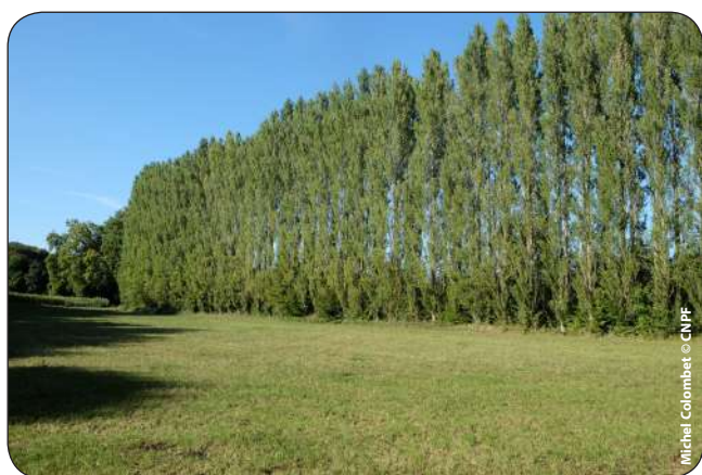
Alignement de peupliers d'Italie