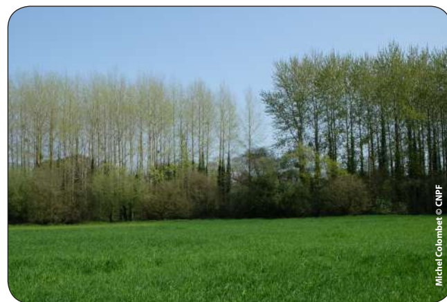
La date de débournement* varie selon le cultivar