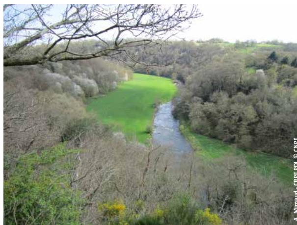
Le Parc pour valoriser et protéger le patrimoine naturel.

Ce projet n'entraîne aucune réglementation directe. Néanmoins, il doit être pris en compte dans l'élaboration des documents d'urbanisme et des schémas de cohérence territoriale.