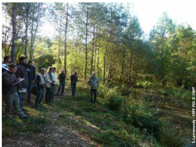
Le Parc pour l'éducation et l'information du public.