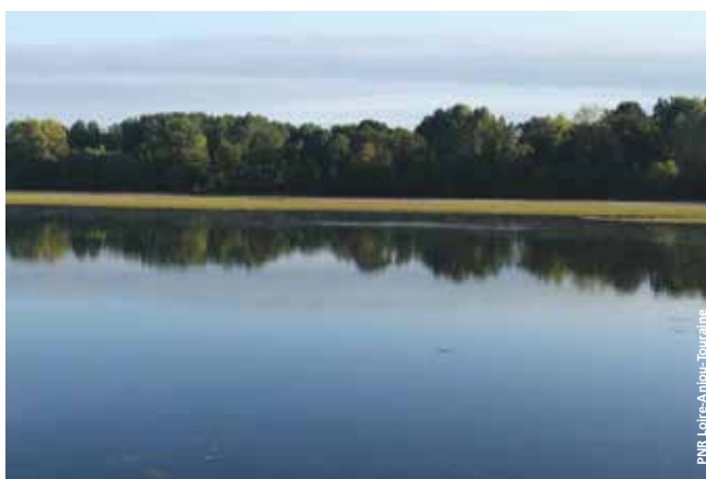
Vue des bords de Loire, secteur du Thoureil.