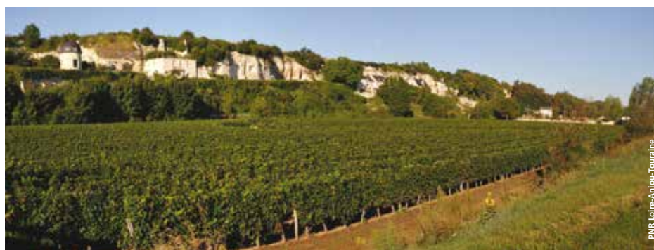
Domaine viticole, secteur de Turquant.

Consultez la rubrique « En savoir plus » pour découvrir la charte du Parc.